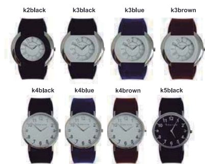
Modèles de montres

Kéruvé est une solution efficace pour les problèmes de désorientation des personnes atteintes de la maladie d'Alzheimer. Il permet à la famille de récupérer son proche perdu incapable de revenir au domicile, ou d'être averti d'un franchissement d'une zone un peu trop éloignée de la maison.