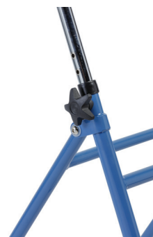
Rondo de verrouillage

Equipé d'un siège capitonné confortable, le rollator Simply , avec son cadre en acier pliable, est équipé de deux poignées anatomiques assurant une bonne prise en main et s'ajustant en hauteur à l'aide de deux molettes de fixation.