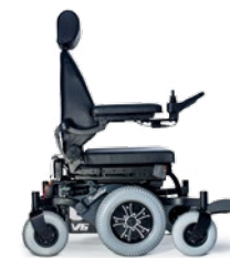
PNEUS HYBRID - GRIS

"NOUS CRÉONS DES FAUTEUILS ROULANTS SUR MESURE DEPUIS 20 ANS POUR QUE VOUS PUISSIEZ VIVRE VOTRE VIE"