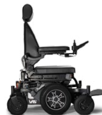
PNEUS HYBRID - NOIR