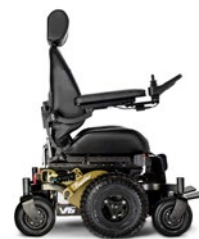
PNEUS TOUT TERRAIN - JANTES NOIRES