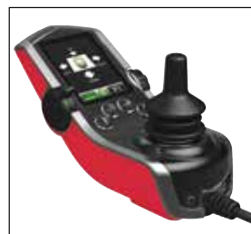
Manipulateur évolutif Q-Logic 2