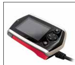
Contrôle d'environnement Infrarouge