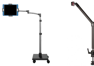
BRAS DE SUPPORT SUR ROULETTES OU BRAS DE SUPPORT SUR FAUTEUIL ROULANT