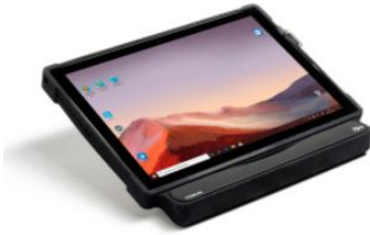
TABLETTE SURFACE PRO + CAMERA OCULAIRE IRISBOND HIRU